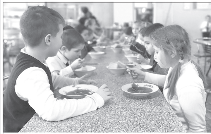
Предусмотрено бесплатное горячее питание детям граждан, принимающих участие в спецоперации

Законопроекты поддержаны комитетами и будут рекомендованы к принятию на пленарном заседании.