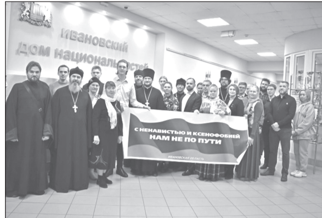
Все участники флэш-моба договорились об объединении усилий