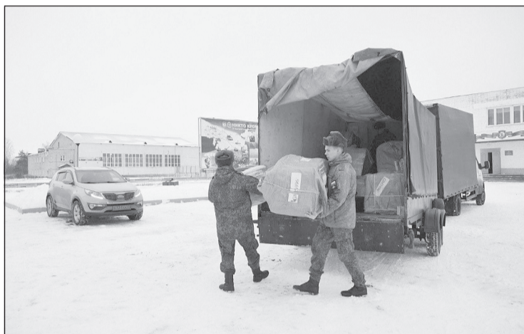
Фонд передал первую партию помощи участникам спецоперации

Представители Благотворительного фонда «Своих не бросаем» передали в воинскую часть Ивановской области первую партию специальной тактической обуви, выполненной по запросу военнослужащих. Уже в ближайшее время она будет отправлена ребятам на передовую.