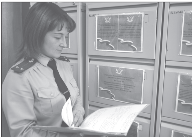
Сиротам не верится, что они получили жильё

Благодаря работе судебных приставов Межрайонного отделения судебных приставов по исполнению особых исполнительных производств УФССП России по Ивановской области шесть граждан из категории детей-сирот и детей, оставшихся без попечения родителей, смогут справиться новоселье.