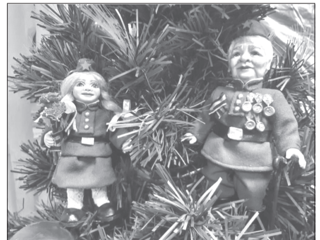
Такие игрушки, стилизованные под ёлочные украшения военного времени, создают умельцы

Жители Ивановской области могут принять участие в новогоднем конкурсе семейного творчества. Всероссийский конкурс «Мастерская Деда Мороза» запустил Красногорский филиал Музея Победы. Организаторы предложили ребятам и их родителям создать своими руками игрушки, стилизованные под ёлочные украшения военного и послевоенного времени или посвященные Победе в Великой Отечественной войне.