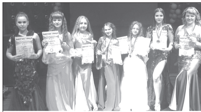
Наши ошеломительно талантливые танцовщицы