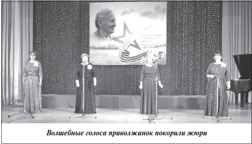
Волшебные голоса приволжанок покорили жюри

Народный вокальный ансамбль «Гармония» ГДК после долгого перерыва принял участие в Межрегиональном фестивале-конкурсе военно-патриотической песни «Сей, зерно», посвященном памяти М.А.Дудина.