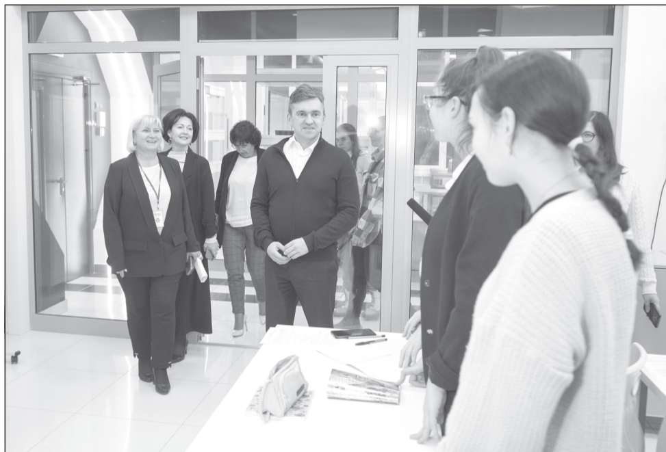
На базе «Соляриса» ребята смогут заниматься школьными дисциплинами на углубленном уровне и готовиться к олимпиадам.

На базе «Соляриса» ребята смогут заниматься школьными дисциплинами на углубленном уровне и готовиться к олимпиадам. Помо-