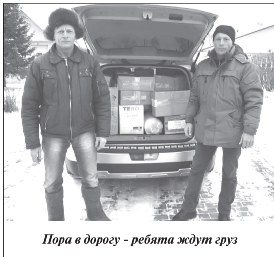
Пора в дорогу - ребята ждут груз