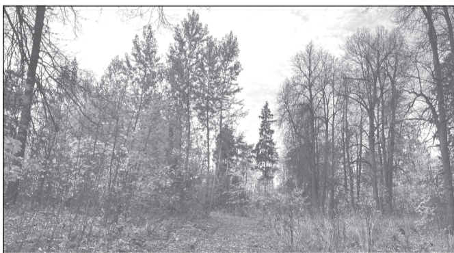
Сбережем этот уютный уголок природы для потомков

С целью устранения нарушений закона природоохранным прокурором Главе администрации городского округа Шуя внесено представление.