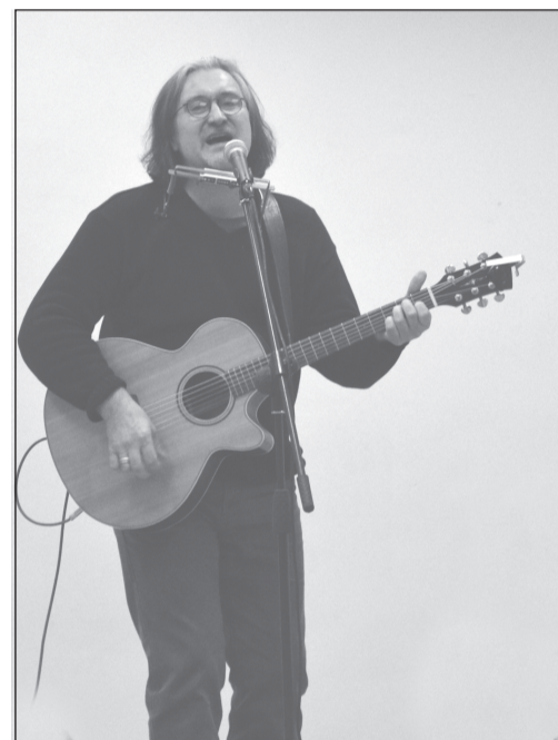
А. Строев – певец, музыкант, актёр, режиссёр...

Пример творчества Александра Строева – это как раз то, что называется творчеством без границ, и как хорошо, что благодаря фестивалю в наш город приезжают такие большие артисты, незаурядные творческие личности.