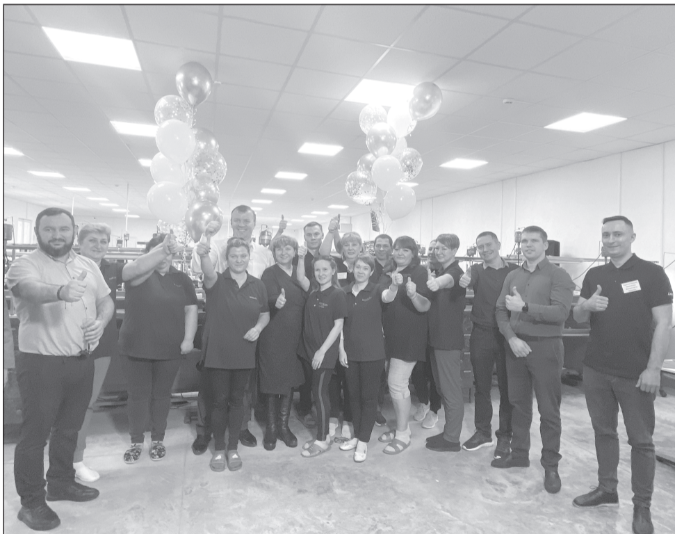
Новое производство – первая ласточка. Желаем, чтобы число рабочих мест, престижных и разных, увеличивалось

На прошлой неделе состоялось значимое для района и города событие - открытие нового производства и создание новых рабочих мест фирмой, которая стала одним из ведущих игроков на ювелирном рынке России.