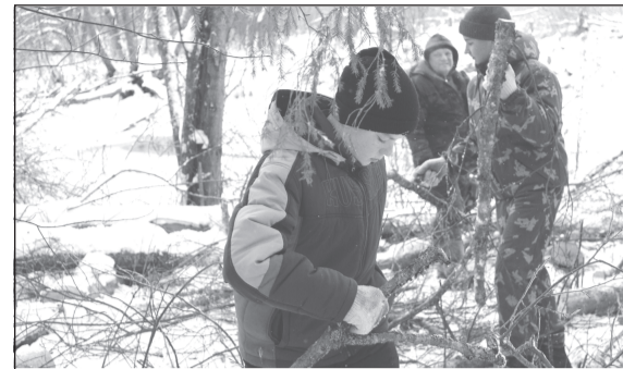
Субботник в лесном массиве

Здесь в историко-патриотическом комплексе «Партизанская застава» во время ураганного ветра поломало несколько деревьев, которые стали представлять угрозу для людей при проведении патриотических мероприятий. Стволы поваленных деревьев будут использованы для дальнейшего строительства элементов комплекса, а из сломанных веток получился хороший костёр, возле которого все могли погреться и отдохнуть с разговорами о дальнейших планах по работе историко-патриотического комплекса и самого лагеря.