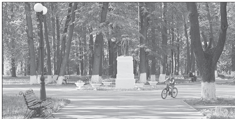
Всего благоустроят 20 общественных пространств в 19 муниципалитетах.

Размер федерального гранта составит 85 млн рублей. Напомним, что инициаторами по благоустройству данной территории являются жители, которые в 2020 году на встрече с губернатором Ивановской области подняли вопрос по благоустройству Привокзальной площади.