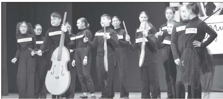
«Квартет» И.А. Крылова в лицах