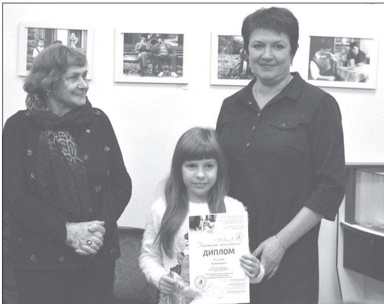
Награждение победителей конкурса

Удивительная женщина: яркая, но в то же время скромная, она никогда не гналась за личным успехом, всю свою жизнь посвятила семье – талантливым и творческим мужу и сыну. Теперь, когда их нет на этом свете, она продолжает хранить их память, жить воспоминаниями и, если предоставляется возможность, то пользуясь ею, передаёт их людям. Такой чудесной возможностью, несомненно, является наш фестиваль «Запомните меня таким».