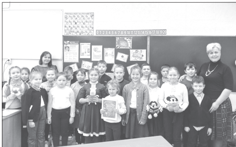
Ребята в игровой форме познакомились со своими основными правами и обязанностями

Проведение таких мероприятий, занятий, уроков призвано помочь школьникам получить собственные представления о современных правовых и моральных ценностях общества, способствовать развитию компетентности учащихся в защите прав, свобод и законных интересов личности.